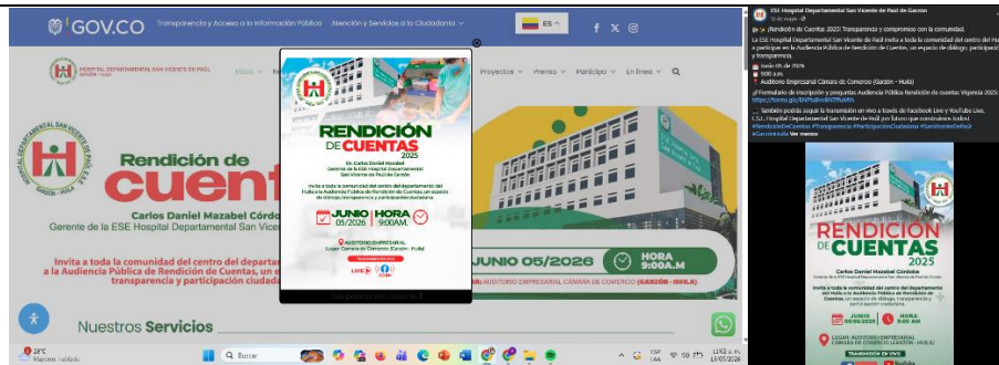
Publicación Convocatoria Segunda Fecha 05/06/2026