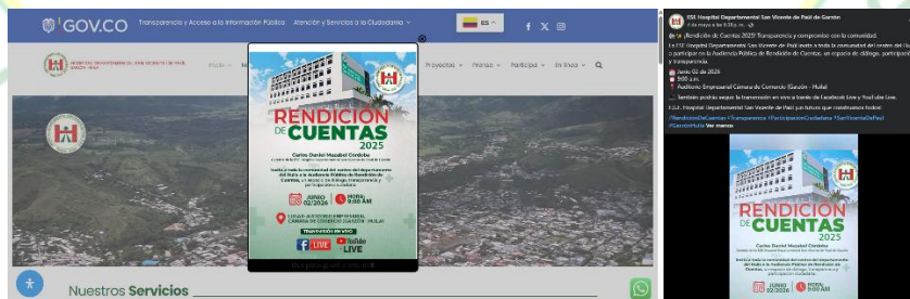
Publicación Convocatoria Primera Fecha 02/06/2026