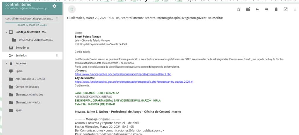
Ilustración 1 "Evidencia correo electrónico solicitando la confirmación del reporte a la Unidad Funcional de Gestión Humana"