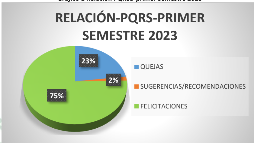
Gráfico 1 Relación PQRSD primer Semestre 2023