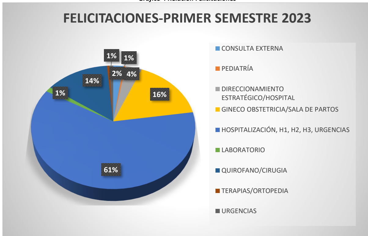
Gráfico 4 Relación Felicitationes