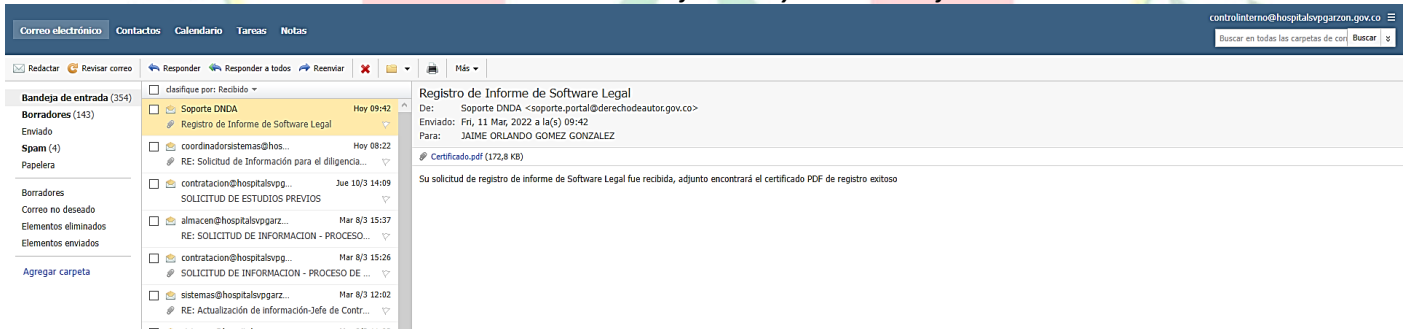
Ilustración 2 Correo de confirmación y envío del certificado