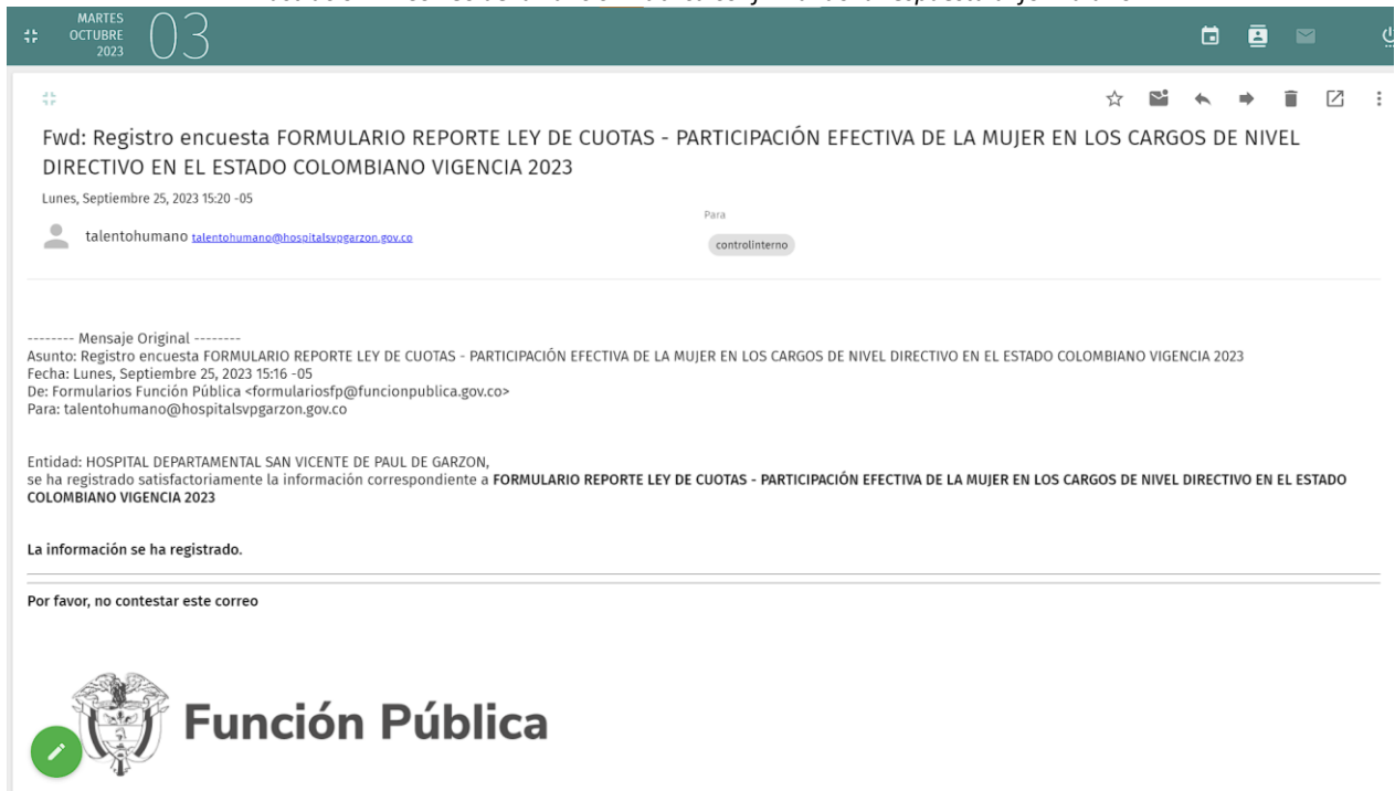
Ilustración 2 "Correo de la Función Pública confirmando la respuesta al formulario"